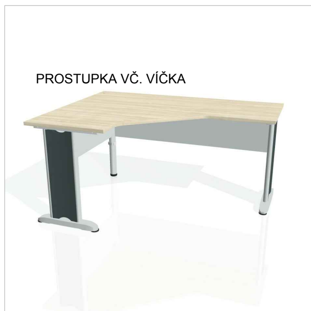
PROSTUPKA VČ. VÍČKA

PRAC. STŮL PRAVÁ VARIANTA 1600x755x1200(600x600)MM TL. PRAC. DESKY MIN. 25MM + HRANY ABS 2MM + HLINÍK. PODNOŽE