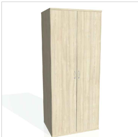
ŠATNÍ POLIC. VLOŽKA KOV. VÝSUV - VĚŠÁK